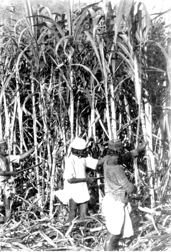
उन्नीसवीं सदी के उत्तरार्ध में सूरीनाम के खेतों में गन्ना काटते हुए भारतीय गिरमिटिया मजदूर

गाँधी ने आगे लिखा : 'वास्तव में गिरमिटिया अर्ध-दासत्व की स्थिति है। पहले के दासों की तरह गिरमिटिया मजदूर भी अपनी आज्ञादी नहीं खरीद सकता। एक दास को काम न करने के लिए दण्डित किया जाता था; वैसे गिरमिटिया भी। यदि वह लापरवाह है एक दिन काम नहीं करता, अगर जुवान लड़ाता है तो उसे इनमें से किसी भी अपराध के लिए जेल जाना पड़ेगा। एक दास को एक मालिक से दूसरे को बेचा जा सकता था; वैसे ही गिरमिटिया को भी। दास के बच्चे दासत्व को विरासत में पाते थे; कुछ उसी तरह गिरमिटिया के बच्चे एक क्रानून के अधीन हैं जो विशेष रूप से उन्हीं के लिए पारित किया गया है। ... इसके सिवा यह भी रेखांकित किया जाना चाहिए कि गिरमिटिया प्रथा दासप्रथा के उन्मूलन के बाद आयी और गिरमिटिया मजदूर को दासों के स्थान पर नियोजित किया गया।'