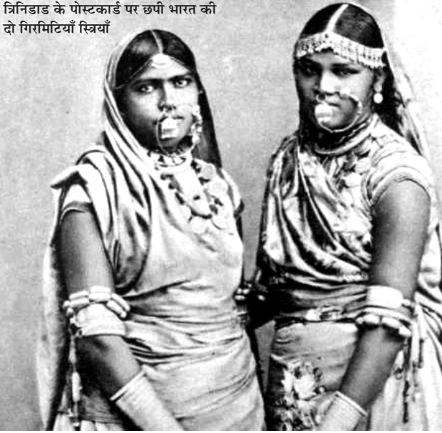
त्रिनिडाड के पोस्टकार्ड पर छपी भारत की दो गिरमिटियाँ स्त्रियाँ

बाग़ानों में एक आज़ाद दुनिया थी जो उन पितृसत्तात्मक बंधनों से मुक्त थी जो भारत में लैंगिक संबंधों को आकार देती थी। बाग़ानों में तुलनात्मक रूप से लैंगिक बराबरी मिली हुई थी जिसके तहत स्त्रियों को अपना साथी चुनने की आज़ादी थी। जब कभी भी किसी स्त्री को अपने पति या प्रेमी से समस्या होती, वो तलाक़ लेने या अलग होने को आज़ाद थी जो कि भारत में आसान नहीं था। बाग़ानों की व्यवस्था ने अंतर-जातीय और अंतर-धार्मिक विवाह के प्रतिबंध को भी तोड़ दिया था। बाग़ानों में अक्सर जोड़ों की आपसी रज़ामंदी ही विवाह का आधार थी। भारतीय राष्ट्रवादी ऐसी बातों से बहुत विचलित थे।