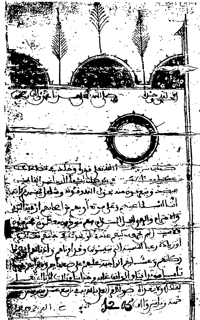
الوثيقة رقم 8

ظهير التوقير والاحترام للشرقاء الودغريين أهل فجيح من السلطان مولى يزيد بن محمد بن عبد الله سنة 1790/1205، يأذن لهم بموجبه بصرف زكواتهم وأعشارهم على ضعفائهم، كنموذج.